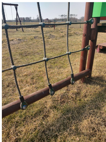
c) naprawa ogrodzenia,